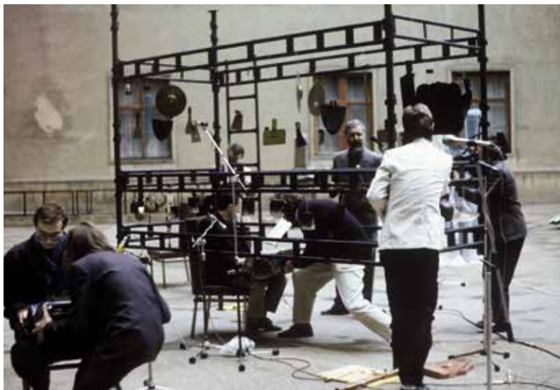
Transmusic comp.: koncert na nádvoří Bratislavského hradu při příležitosti konference a výstavy Umenie proti totalite / Concert in the courtyard of Bratislava Castle on the occasion of the conference and exhibition Art Against Totalitarianism, Bratislava, 1990

byly hlavně dlouhodobé rezidenční pobyty, festivaly a symposia vázané na lokalitu barokního cisterciáckého kláštera zasazeného do západočeské krajiny. Těžiště Studia erte se od zájmu o experimentální poezii ubíralo směrem k umění akce a performance, a využívalo prostranství a ulice slovensko-maďarského města Nové Zámky. Společnost pro nekonvenční hudbu ve slovenské metropoli na druhé straně pořádala koncerty a performance, které většinou přesahovaly zavedené formy hudebních žánrů.