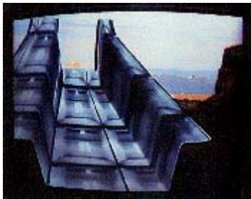
Woody Vasulka: "Studies" (for ORF Commission), 1986