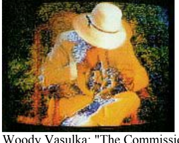
Woody Vasulka: "The Commission", 1983