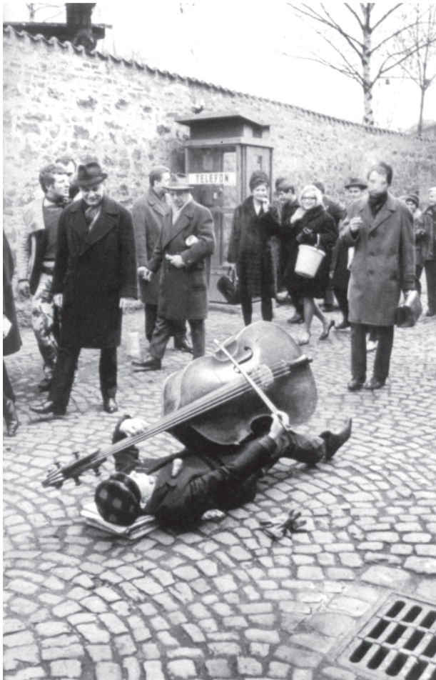
4, 5 – Milan Knížák, Aktuální procházka po Novém světě , 1964

níky, přesto však nadále zůstávají poněkud aranžovanou uměleckou událostí. Ta je většinou založena na realizaci předem připraveného libreta. Dost často se jedná o proměnu určitého prostředí spontánní nebo organizovanou činností účastníků. 21 Většina Kaprowových happeningů byla realizovaná v rámci institucí, ať už to byly galerie, univerzity nebo festivaly. To také do značné míry ovlivnilo jejich charakter. Pokusíme-li se zobecnit Kaprowův přístup, jde v podstatě o průzkum situací. Kaprow je k nim ale neutrální, pouze je odkrývá a ozvláštňuje. Knížák je naopak mnohem více angažován v samotném životě a jeho akce jsou realizovány mimo jakýkoliv umělecký kontext. Vzdaluje se v nich od pojetí akčního umění jako experimentálního uměleckého projevu a ukazuje, že jde o vážnou životně nutnou aktivitu, která má za cíl obrodu společnosti. Jak píše v letáku, který Aktual publikoval po pražském vystoupení Fluxu : „ Nevynalézat nové umělecké formy, ale přímo měnit každodenní život jednotlivce. “ 22 Tento postoj je jistě dán i samotnými kulturně politickými podmínkami každého z autorů. Neexistence relevantních uměleckých institucí a širší avantgardní platformy v Čechách je bezesporu jedním z momentů, které vytvo-