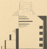
VIKING EGGELING. FILMKOMPOSITION