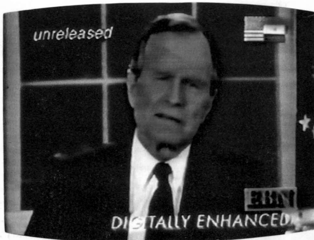
Emergency Broadcast Network, 1998 video (sin título/untitled).