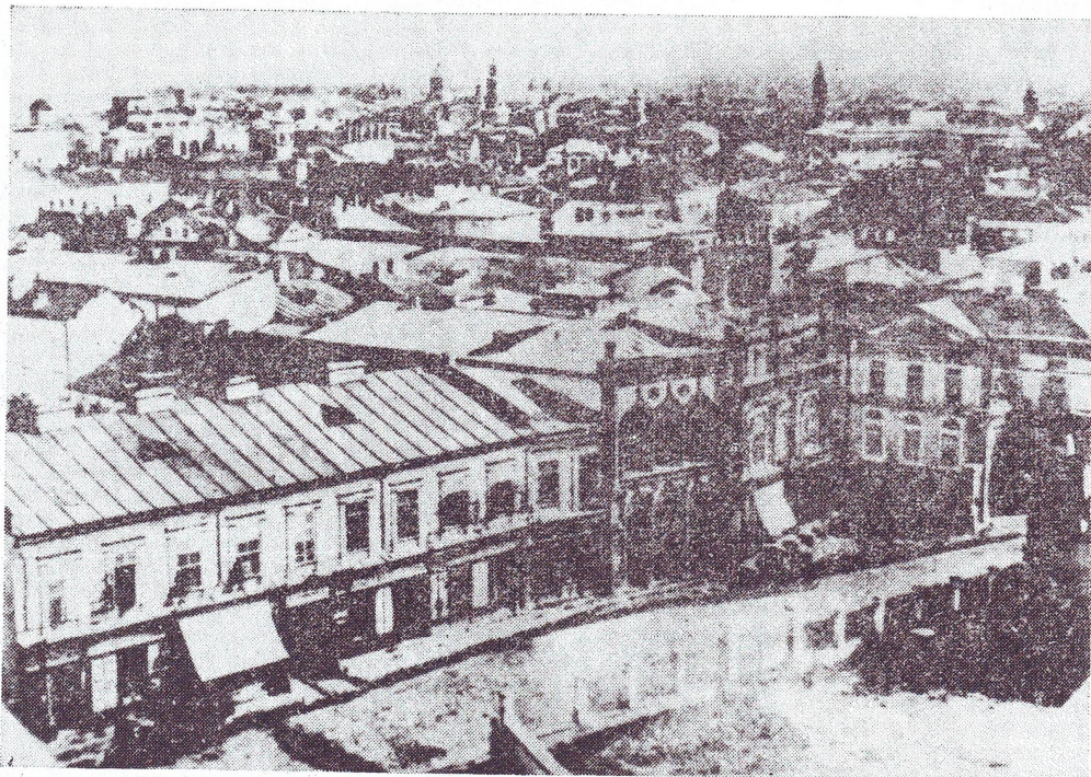
Fig. 3 — Podul Mogoșoaiei în Piața Teatrului Național la 1856

toate probabilitățile era o cafenea. Avem astfel o imagine rară, dacă ținem seama că aceste cafenele roiau îndeosebi, în jurul curții domnești în vecinătatea imediată căreia se afla Piața de Flori.