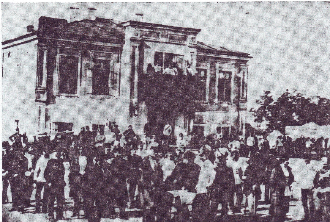
Fig. 4 — Casa Meitani

Unul dintre acesta a fost cel din apropierea Podului Mihai Vodă, în spatele Casei Apelor 9) , surprins în imaginea lui Angerer. Din aceeași perioadă — mijlocul secolului XIX — este cunoscut încă un foisor, acela din turnul Colței.