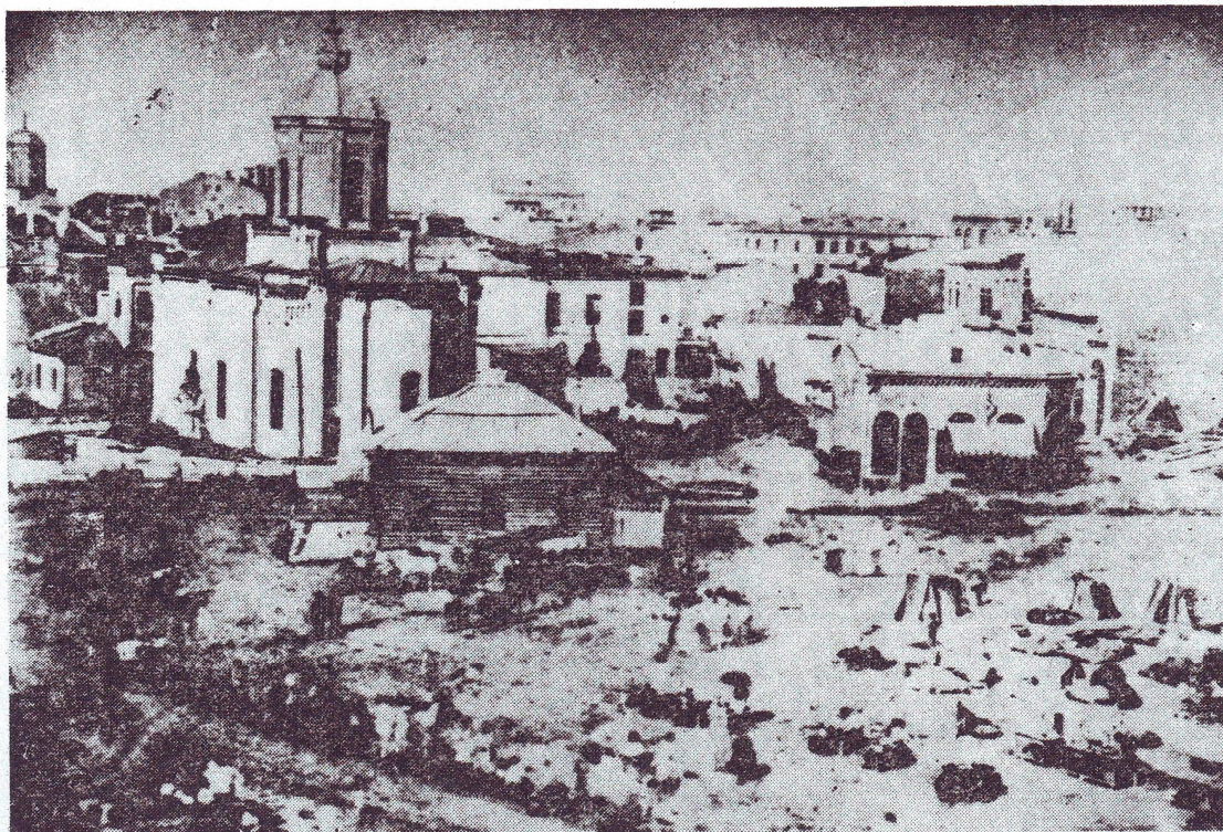
Fig. 1 — Piața de flori cu cafelea

supărări. Aceleași mori împiedicau curgerea ei normală. De aceea, în 1865 morile de pe Dîmbovița au fost desființate printr-un decret al lui Mihail Kogălniceanu. Valoarea fotografiei — constă în aceea că ne înfățișează Dîmbovița înainte de canalizare cu clădiri care mai păstrează elemente orientale în arhitectura lor și lucru cu totul nou — existența unui pod de piatră — semn al continuei modernizări.