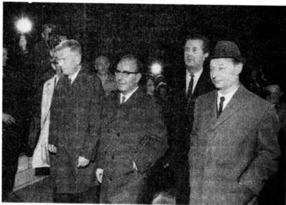
Návrat delegace z Moskvy (říjen 1968)