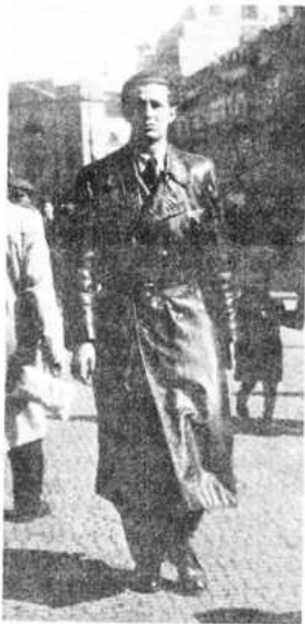
Funkcionář SČM 1948