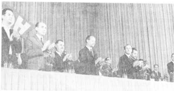
Červen 1968: konference ROH – v delegaci s O. Černíkem a A. Dubčekem