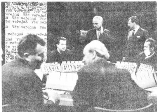
Televizní beseda o demokracii v únoru 1968

Po zvolení do sekretariátu ÚV KSČ v dubnu 1968