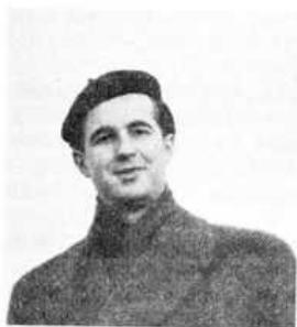
Po návratu ze studií v Moskvě r. 1955