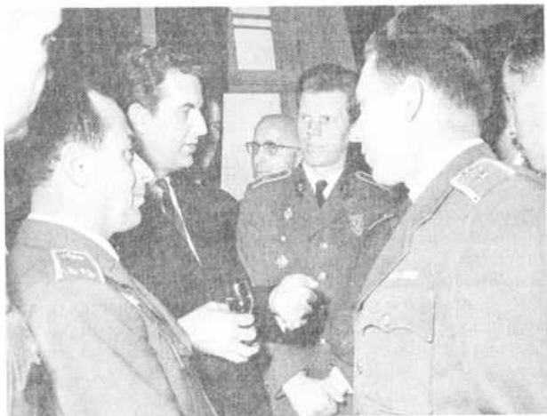
S absolventy vojenské akademie v červnu 1968