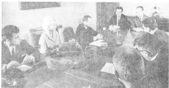
Jednání Z. Mlynáře a A. Dubčka se zástupci ČSM a společenských organizací