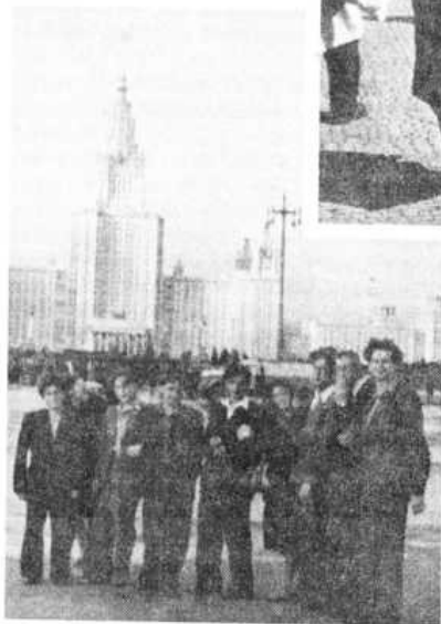
Studium v Moskvě. (Otevření nové budovy Moskevské státní univerzity. 1. 9. 1953)