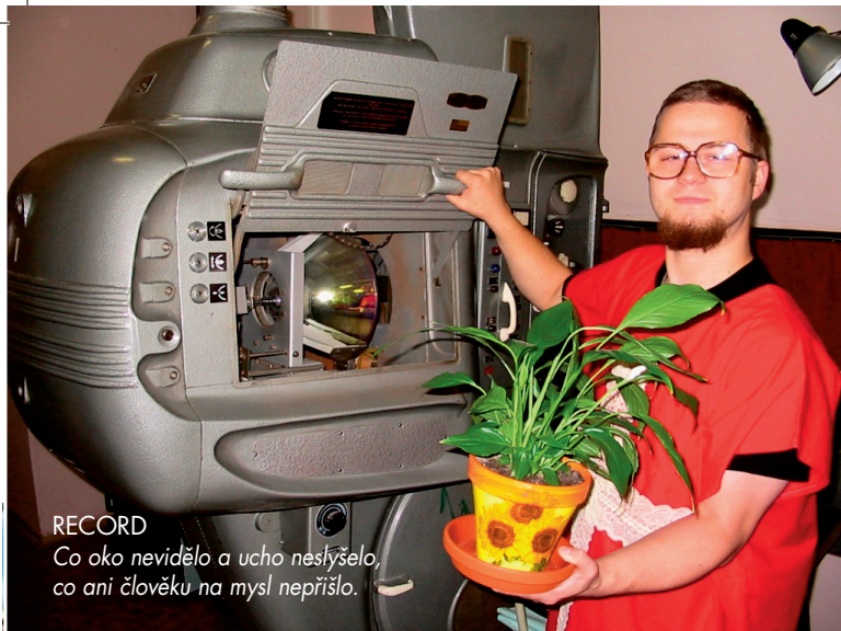
RECORD Co oko nevidělo a ucho neslyšelo, co ani člověku na mysl nepřišlo.