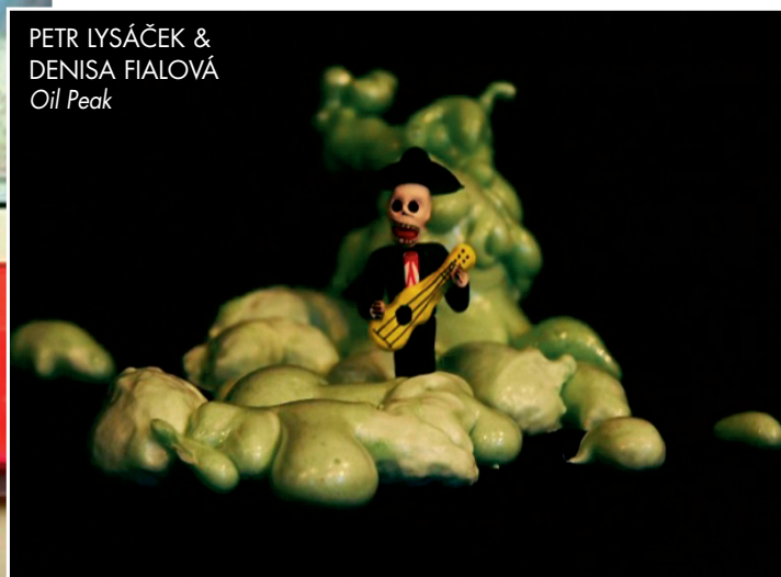
PETR LYSÁČEK & DENISA FIALOVÁ Oil Peak