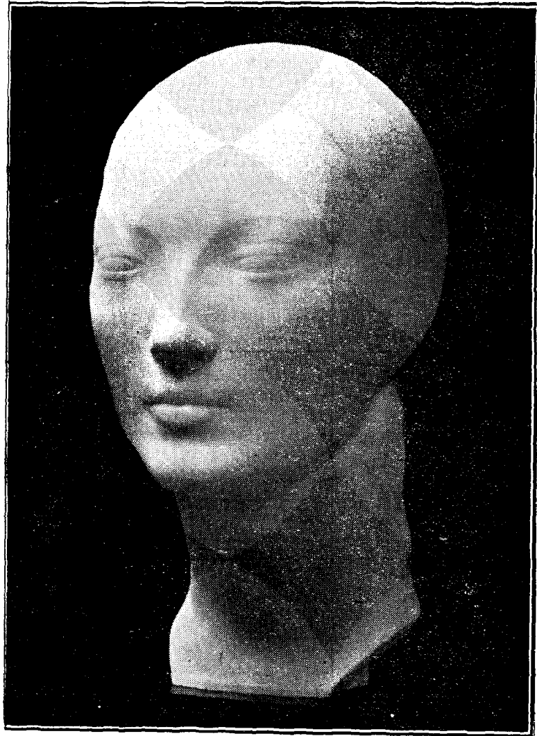
Daria, sculptură de Irina Codreanu