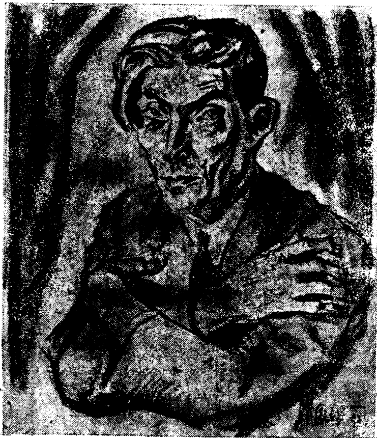
Desen de S. Maur