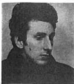
KETIL SÆVERUD Født 1939 Komponist Siljustøl, Rå i Fana