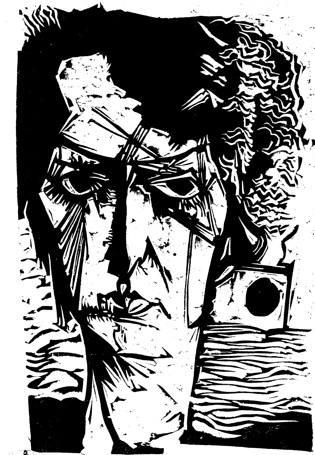
CLARA HASKIL, — Xilografie originală de Marcel Iancu