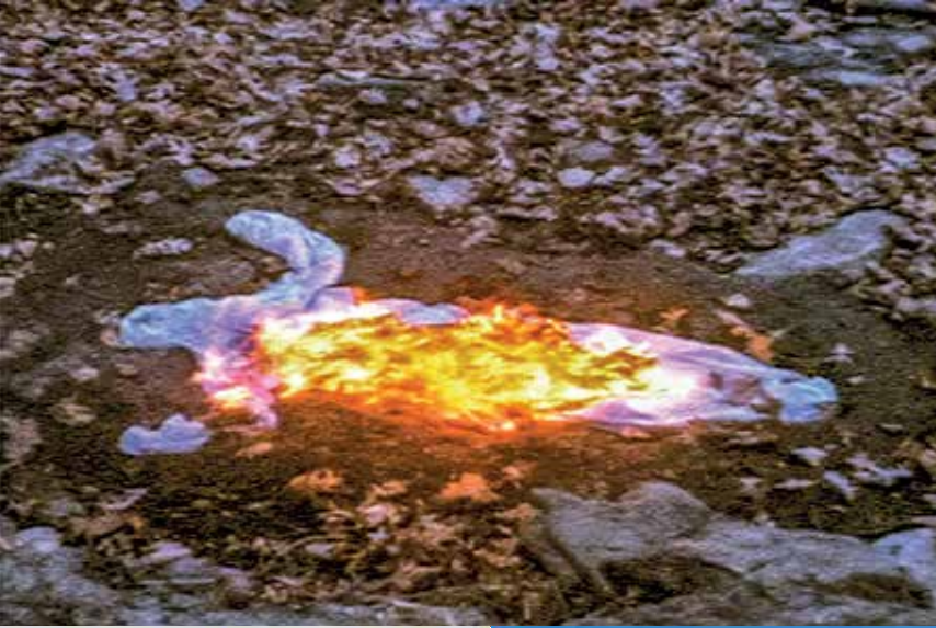
1. Ana Mendieta Alma, Silueta en fuego , 1975. Super-8mm color. Film mudo transferido a/ Silent film transferred to DVD. Edición/Edition 5/6. 3,07'. Fotogramas/ Stills. En/at Verboamérica. Colección MALBA