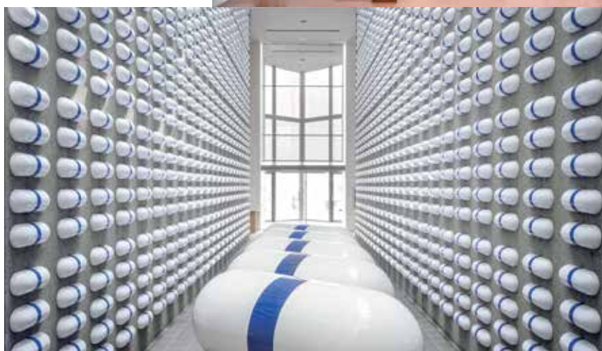
5. General Idea, One year of AZT, 1991. 1825 cápsulas de estireno al vacío montadas sobre pared/1825 wall- mounted capsules of vacuum-formed styrene with vinyl. 12.7 x 31.7 x 6.3 cm cada una/each.