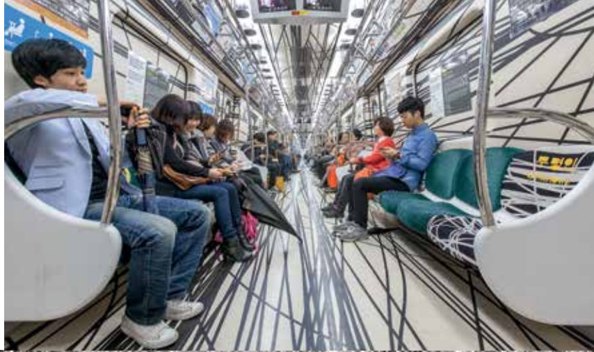
1. Raq5 Media Collective, Autodidact's Transport , 2012. Intervención en un tren del subterráneo de Gwangju/Intervention on a train of the Gwangju Metro durante la/for the Gwangju Biennale