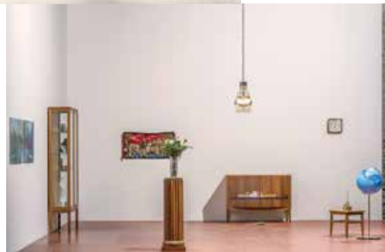
4. Meriç Algün Ringborg, Souvenirs for the Landlocked , 2015. Instalación/Installation.