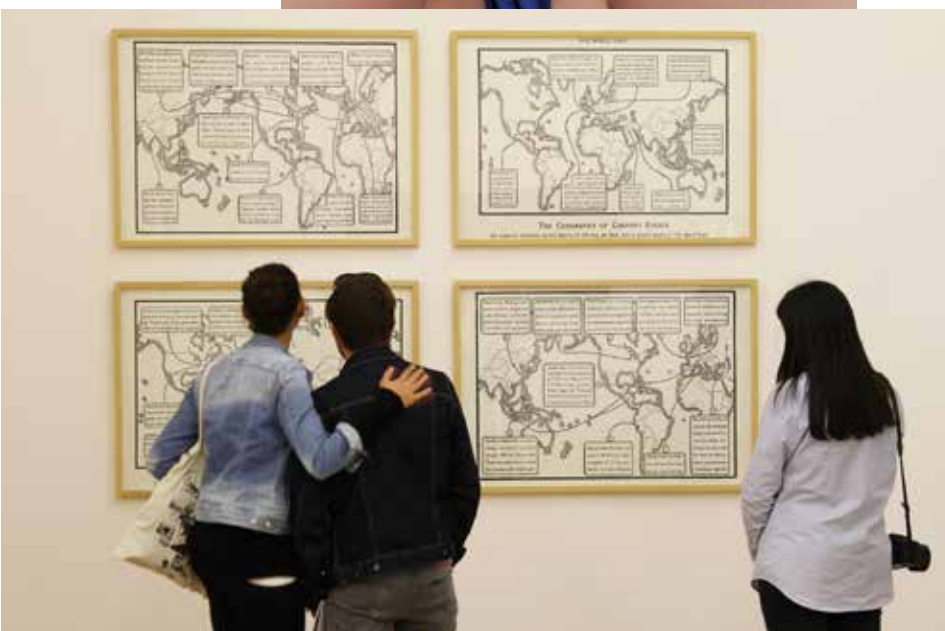
5. Fernando Bryce, The World Over / 1929 , 2011. Cuatro serigrafías sobre papel/Four silkscreens on paper. Edición/Edition 3/5. 70 x 100 cm cada una/ each. En/at Verboamérica. Colección MALBA