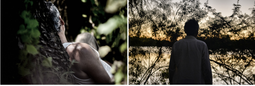
Imágenes 29 y 30. La percepción háptica en El limonero real asume la experiencia de Wenceslao, el personaje a partir del cual fluye una narrativa sensorial.

real , la tensión establecida entre los planes hápticos, y su desbordamiento en las escenas siguientes no hápticas, es una de las formas de apertura a una experiencia dispersiva que caracteriza al realismo sensorial de la película. El limonero real refuerza las atmósferas y la ambigüedad narrativa al adoptar una mirada microscópica sobre el espacio tiempo y una experiencia afectiva pausada por la presencia de una sensorialidad multilineal y dispersiva. La serie del río en su conjunto desarrolla una especie de pedagogía de lo visual y de lo sonoro, vinculado a cierta dosis de sensibilidad táctil en la imagen y el sonido que nos invita a volver a aprender a ver y escuchar una película.