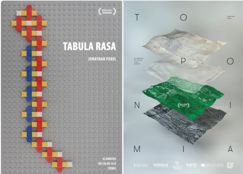
Imágenes 41 y 42. Los afiches de Tabula rasa y de Toponimia dan cuenta del carácter lúdico y performático del mapeo.