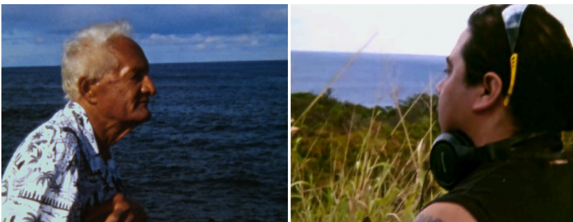
Imágenes 19 y 20. Tierra sola enfatiza las paradojas de la libertad: tanto los ancianos como el ex presidiario son eternos guardianes del horizonte.

“grano” que sugiere la materialidad de un cuerpo emisor, este tarareo de origen incierto no hace sino destacar aún más la ausencia de dicho cuerpo, lo que se pone en evidencia luego en los créditos finales cuando en una especie de coda vemos y escuchamos, por primera y única vez, la coincidencia en el mismo plano de música, canto y cuerpo cuando la cámara registra a uno de los pascuenses cantando en rapanui durante un asado familiar.