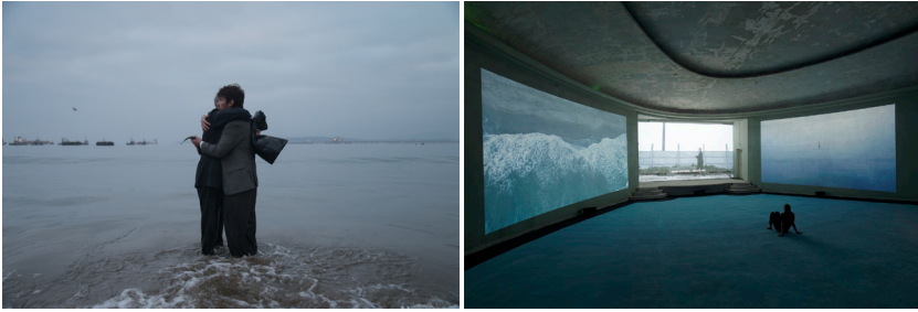
Imágenes 37 y 38. Los durmientes de Enrique Ramírez (tríptico, video, 15'. Exhibición en París, Francia). La escena del centro del tríptico se cierra con un abrazo como parte del ritual sepulcral

al mar, el hombre más viejo lo espera. Intercambian el pez muerto y la bolsa para el cuerpo y, mientras se abrazan, en el panel de la izquierda la cámara cae abruptamente desde el helicóptero al mar. El plano se vuelve negro.