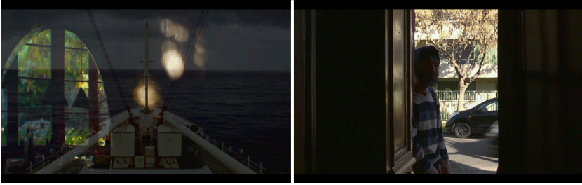
Imágenes 47 y 48. Formas de pasaje en El otro día : superposición de interior y exterior en el hogar y la puerta como el umbral entre la casa y el mundo.