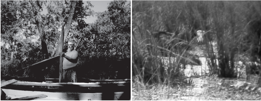
Imágenes 27 y 28. El rostro intercala planos en Super 8 y otras imágenes precarias que sugieren un devenir río de la isla.

Las imágenes porosas y de contornos difuminados que registran los rituales, a la vez cotidianos e irreales, de la isla parecen destinadas a desaparecer. Hay una precariedad e inestabilidad del registro en 8 milímetros que nos lleva a imaginar los vestigios de algo que ya ha sido o a aquello que está por venir. Expresión de lo que queda en la frontera de la vigilia y el sueño, de lo tangible y lo inaprensible, de la vida y la muerte, las imágenes en El rostro están en estado de latencia, como si la película nos invitara a vislumbrar aquello que queda entre un plano y el otro. El de la isla parecer ser un espacio habitado por espectros y la sucesión de planos de la película de Fontán no permite resolver la tensión entre la visión y el conocimiento, el modo de relación entre los muertos y los vivos porque la única forma de conocimiento que parece brotar de ese río se vincula a la intuición y a la sensibilidad. En definitiva, en este nuevo viaje al Paraná, Gustavo Fontán vuelve a explorar todo el potencial del cine para recuperar sensorialmente los espectros de lo viviente y a dibujar una geografía íntima y afectiva desde la sensibilidad y materialidad misma de la imagen.