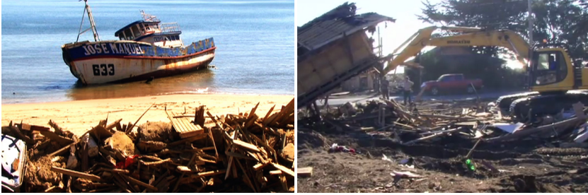
Imágenes 13 y 14. Al igual que la quema “ritual” de escombros y la omnipresencia amenazante del mar, las grúas señalan una deglución dificultosa del duelo en Tres semanas después .

en la costa es un motivo recurrente, una presencia espectral del maremoto pero, al mismo tiempo, una sonoridad que nos habla de un ciclo de la vida, de la naturalidad de esa naturaleza en trizas. Un ciclo que, quizás, debe ser conjurado por medio de la pausa de un plano que atestigüa y elabora la destrucción del paisaje y la quema casi ritual de grandes túmulos de desecho frente al mar, como si se tratara de un sacrificio a un arcaico dios vengativo.