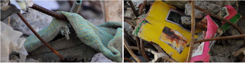
Imágenes 15 y 16. “El clima es un pintor abstracto.” Materiales blandos y textiles en Tierra en movimiento .

que se vuelve él mismo vulnerable a la imagen y puede participar íntima y vicariamente de esa comunidad en la pérdida.