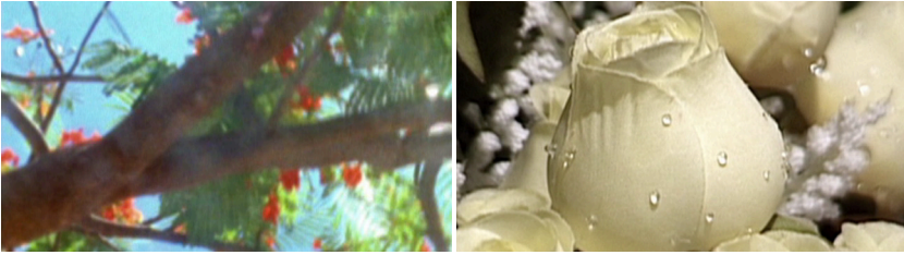
Imágenes 7 y 8. Imágenes precarias de flores naturales y artificiales en Viajo Porque Preciso, Volto Porque Te Amo (dirs. Karim Ainouz y Marcelo Gomes. Rec. Produtores Associados, 2019).