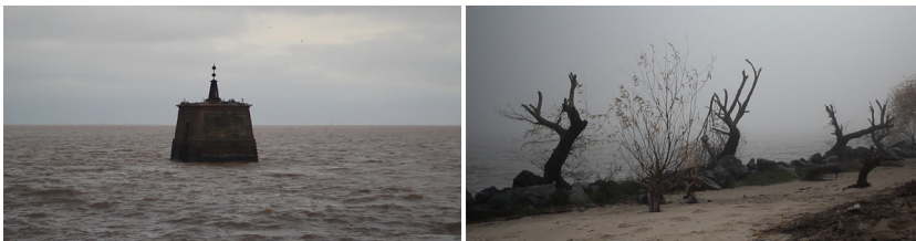
Imágenes 39 y 40. Fotogramas de Las aguas del olvido gentileza de Jonathan Perel.

y nos hace experimentar en tiempo real ese pasado traumático que transcurre delante de nuestros ojos. Una memoria experimentada en tiempo presente que reconoce la existencia de una comunidad de y con los espectros.