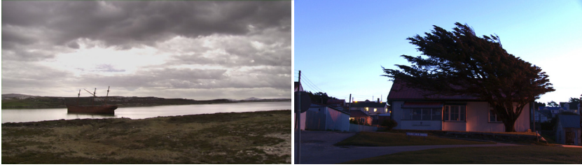
Imágenes 21 y 22. Aislando o vinculando el espacio a la dimensión temporal, La forma exacta de las islas cifra en los paisajes “puros” e “impuros” el proceso del duelo.