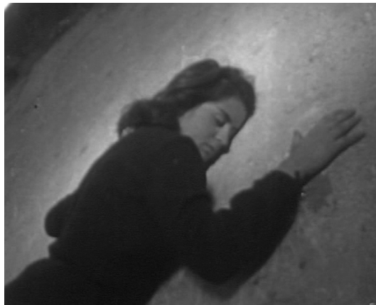
// Кадрови из филма ЗИД

Екипу филма „ЗИД« су, поред Кокана Ракоњца (сценарио, монтажа и режија), чинили: