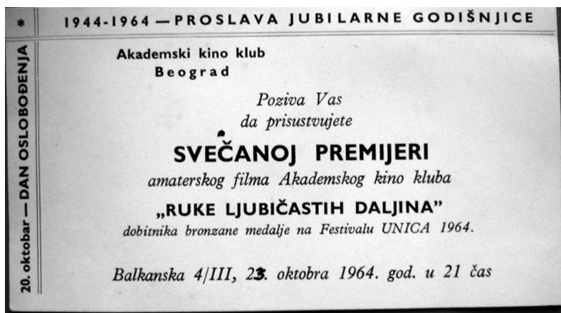
// Позивница за свечану премијеру филма