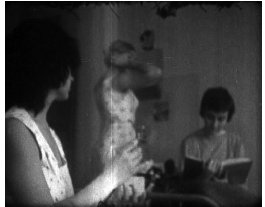
// Кадар из филма РЕПОРТАЖА ИЗ ЖЕНСКОГ БЛОКА

филм је, забуном администрације Савезног фестивала (због његовог назива РЕПОРТАЖА) био третиран као ... документарни и требало је да буде одбачен, тј. дисквалификован. Интервенцијом аутора филм је третиран како је пријављен; тј. као играни и тако је учествовао на VI савезном фестивалу аматерског филма Југославије (Београд, 1960. година) у категорији играних филмова.