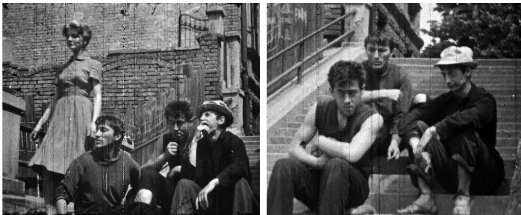
// Кадрови из филма КЛОШАРИ

Филм „КЛОШАРИ“ био је играни и снимљен је током 1961. године, на црно-белој 16 mm филмској траци, по сценарију и у режији Радмила Пејића.