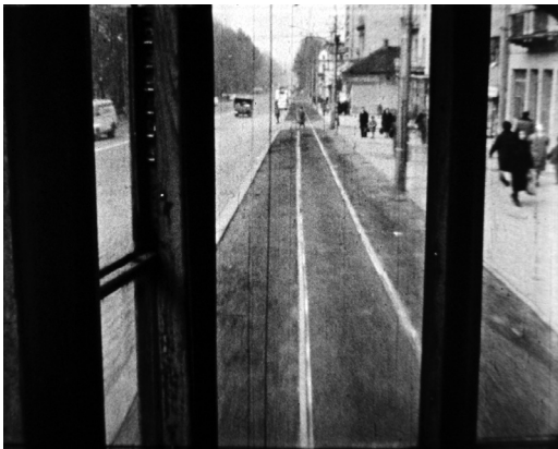
// Кадар из филма ПРАВАЦ

Напомена: – филм представља сарадњу са Кино-клубом ЗАГРЕБ из Загреба; филм снимљен у Београду