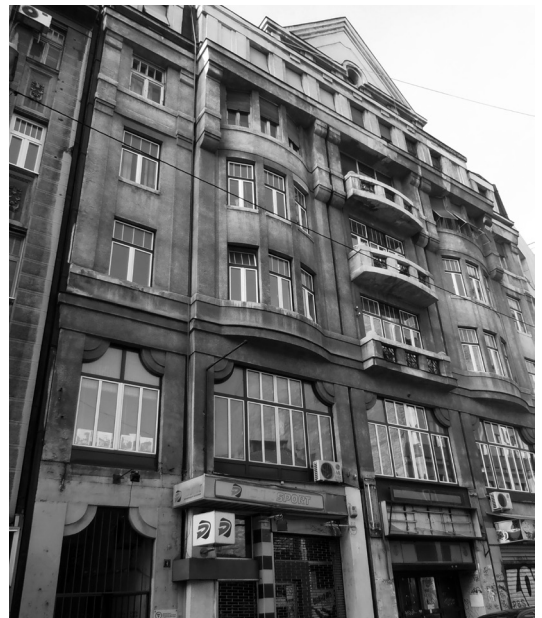
// Балканска 4/4, садашњи изглед

Културној комисији Универзитетског одбора Савеза студената додељене су просторије на четвртном спрату Балканске број 4. То смо искористили, као чланови ове Комисије, и уселили смо се и ми у те просторије, које су нам одлично одговарале (биле су центру