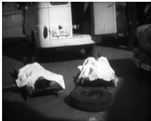
// Кадар из филма МИНУТ МАЊЕ ОД ВЕЧНОСТИ

Напомена: потпуни аутор филма је Миодраг ЈАКШИЋ – ФАНЂО