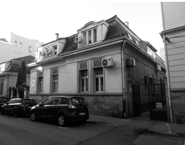
// Зграда у Молеровој 33, садашње стање и намена

Адреса Академског кино клуба Београдског универзитета (АКК) често се мењала, јер није имао сталне просторије. Прво је, углавном за састанке Управног одбора клуба, користио просторије Универзитетског одбора Савеза студената (Балканска 4/III), и то углавном у вечерњим часовима. На ову адресу је стизала и пошта за наш клуб. Киноаматерски течајеви су се у то време одржавали у учионицама разних факултета (прво је коришћен Правни факултет – Булевар Револуције 67 ).