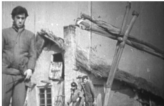
// Кадрови из филма СУЗЕ

тадашњим трамвајем број 9 са свим оним оружјем, униформама, костимима и филмском техником и то до Панчевачког моста. Пешке смо потом прелазили преко моста – уз обавезно показивања потврде Клуба о снимању филма органима обезбеђења моста. Сваки пут су били ревносни. Сцене у тој кућици су, међутим, снимане у просторијама INDEX бара (Балканска 4/ сутерен), што је, свакако, изазвало велики интерес свих структура те зграде (АКУД »Бранко Крسمановић«, Академско позориште, Универзитетски одбор Савеза студената и други) који су ћутке, помно, пратили ово наше снимање, уз коментаре надлежних из Универзитетског одбора – које смо успут чули – како озбиљно приступамо овом снимању, што је све, наравно, било веома значајно за наш »рејтинг« у студентској организацији.