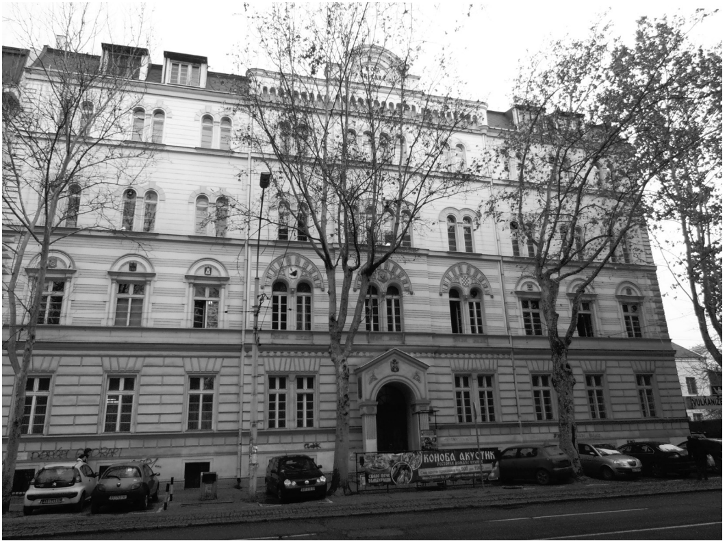
// Данашњи изглед зграде у Душановој 13

генерацију студената Више педагошке школе из Београда (Цара Душана 13) у руковању тонским кинопројектором 16 mm (око 1700 студената). То смо са задовољством прихватили. И захваљујући баш овој обуци добили смо на четвртном спрату те школе једну повећу просторију (није имала прозоре – нико је није хтео). Ту смо се уселили и пренели сав свој намештај, чак смо купили и сточић и три дрвене фотеље, тако да смо користећи текст шпице филма »Зид«, као декорацију просторије, направили врло леп и укусно опремљен простор за рад клуба. Овде смо се задржали дуго времена и колико знам нисмо се никада званично иселили иако смо у међувремену добили просторије у Балканској 4/IV.