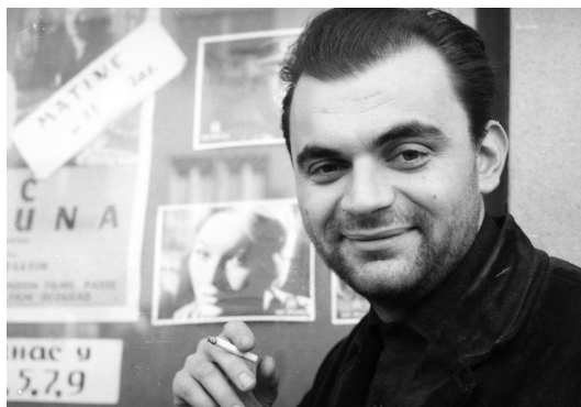
// Том Готовац 1964. године.

Томислав ГОТОВАЦ је недавно, пре своје смрти, гостовао у Београду и том приликом нам је приказао ``двојнике`` ових филмова, верне копије поменутих филмова, али сада снимљене много, много година касније по истим сценаријама; тј. радње су остале исте; док је свс снимано на сасвим другим местима.