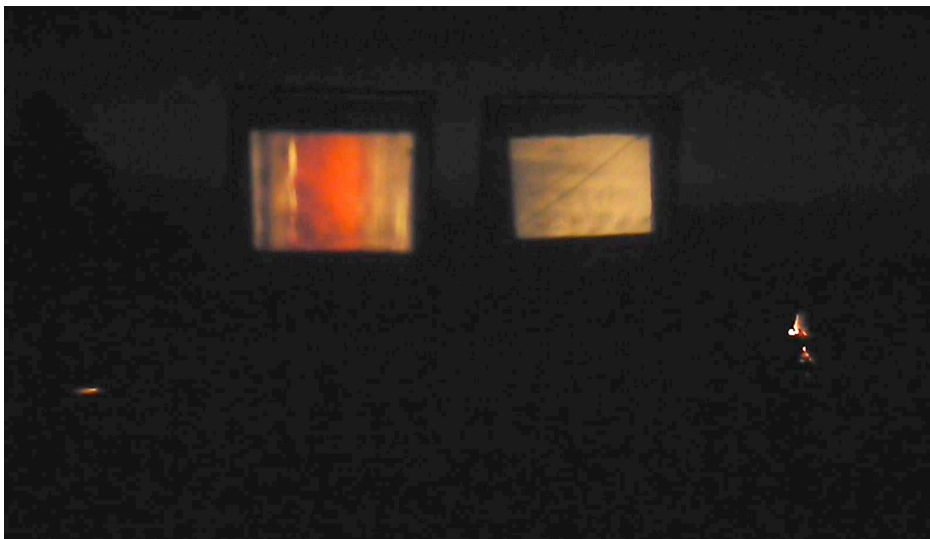
Fotos del Film-Instalación Revém Natura en Playa Mermejita, México. Febrero-2013