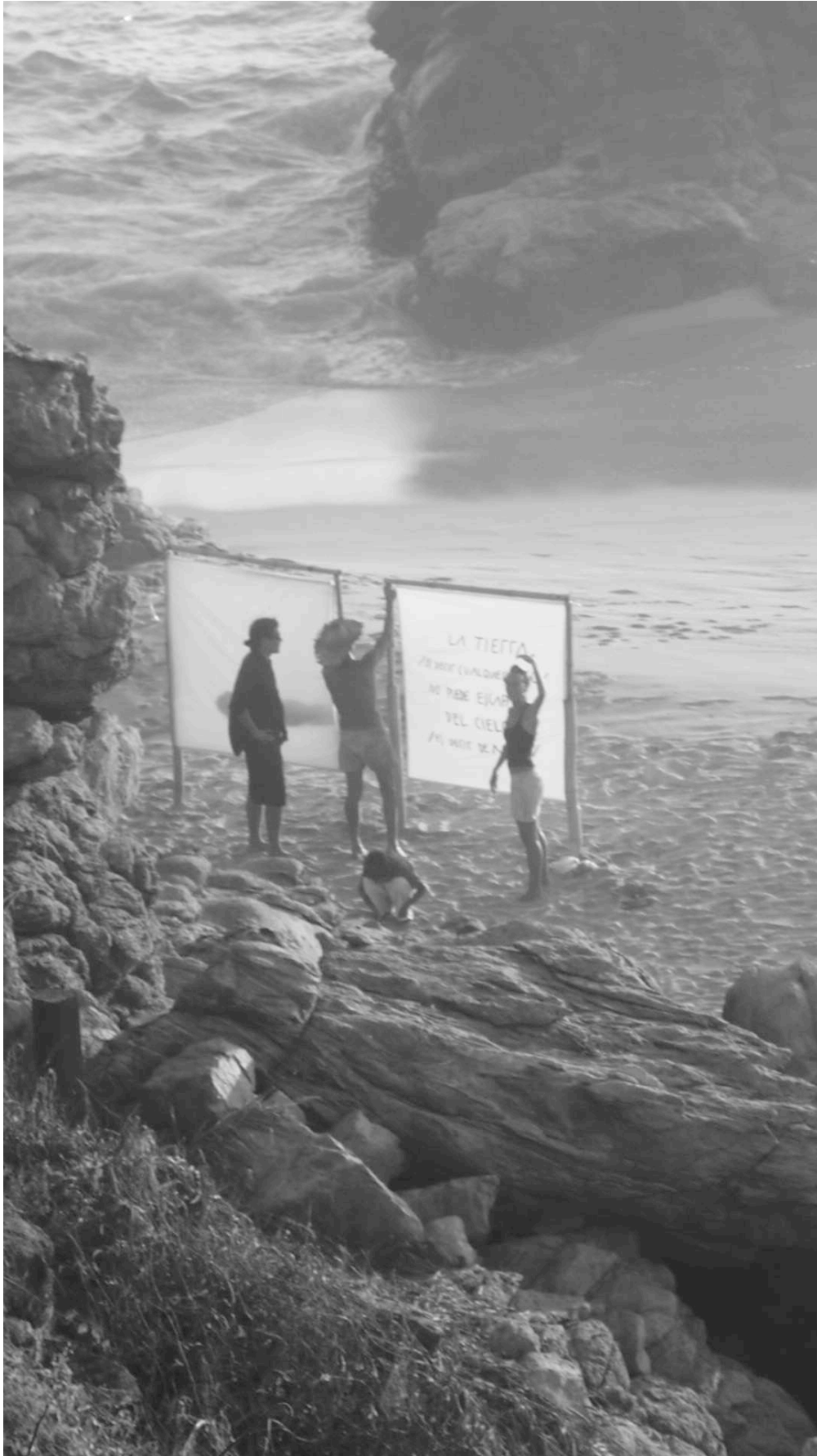
Foto del Film-Instalación Revém Natura en Playa Mermejita, México. Febrero-2013