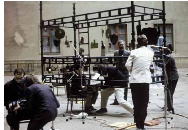
Transmusic comp.: koncert na nádvoří Bratislavského hradu při příležitosti konference a výstavy Umenie proti totalite / Concert in the courtyard of Bratislava Castle on the occasion of the conference and exhibition Art Against Totalitarianism , Bratislava, 1990

Sociální sítě těchto iniciativ se do určité míry vzájemně překrývaly, ačkoli základ jejich aktivit se do značné míry lišil. V případě Plasů to