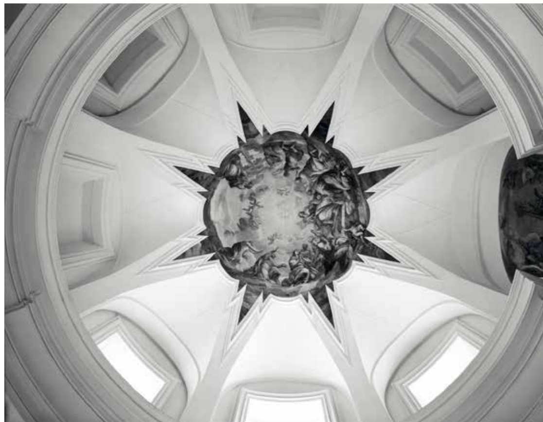
Kaple sv. Bernarda / St. Bernhard Chapel, Plasy