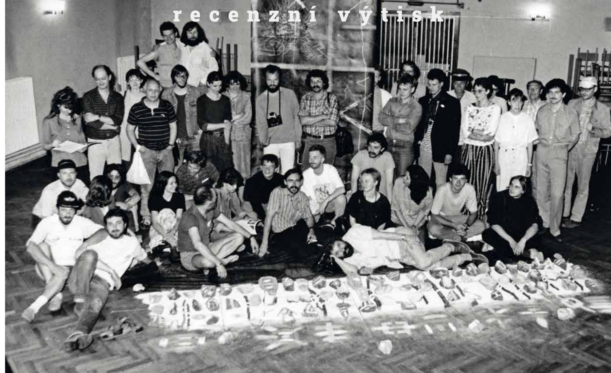
Účastníci 1. festivalu experimentálneho umenia a literatúry / Participants of the First Festival of Experimental Art and Literature, Csemadok, Nové Zámky, 1988. Organizátor festivalu / Festival organiser: Stúdio erté / Studio erté, foto / Photo: Ondrej Berta