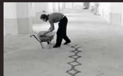
Petr Kvíčala: Ornamenty, instalace, písek, textil, Hermit II, Letokruhy 1993 / Ornaments, installation, sand painting, textile, Hermit II. Growthings, 1993, foto / Photo: Daniel Šperl