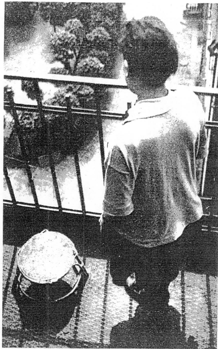
(Снято аппаратом Лейка на киноплёнке.)

Мы уже видели отчасти, как творил-работал-делал Горький своих „Артамоновых“. Горький прекрасно использовал имевшуюся в его распоряжении библиотеку (Горький, Лесков, Мельников-Печерский, даже Мамин-Сибиряк и другие) для фиксации укладно-