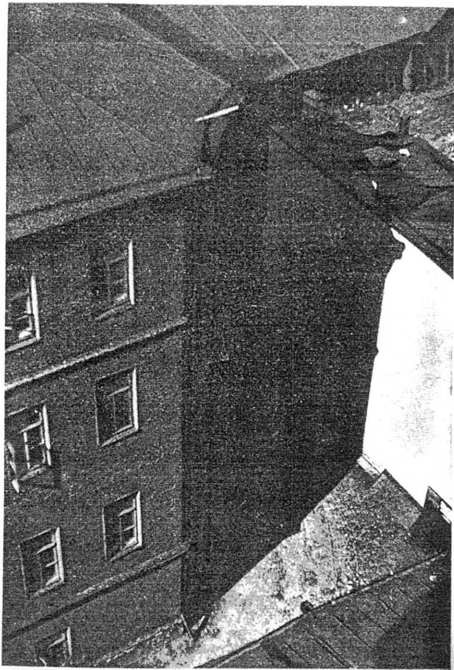
(Снято аппаратом Лейка на киноплёнке.)

Хронологически это верно, и журнал Миллера, конечно, первый русский журнал. Но хронологическое расчленение историко-литературного материала всегда условно и недостаточно.