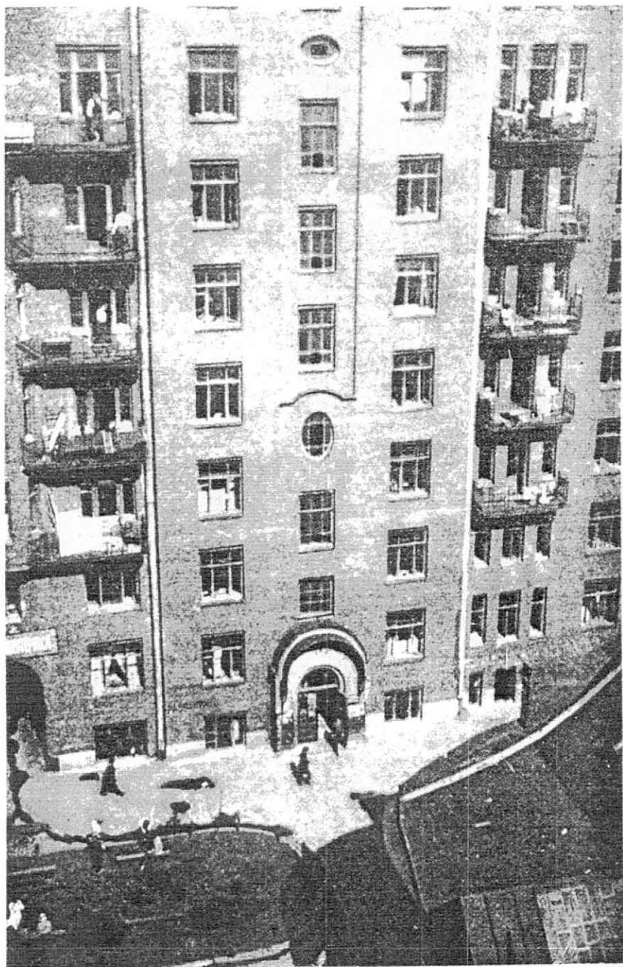
(Снято аппаратом Лейка на кинолентке.)