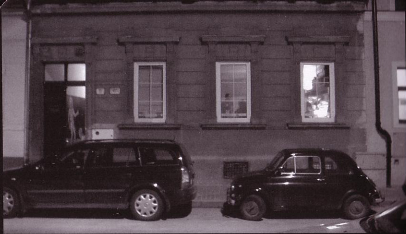
Exteriér. Buryzone, galéria, klub, ideopožižovňa (Čajakova ulica 11, Bratislava). Okolo roku 2002