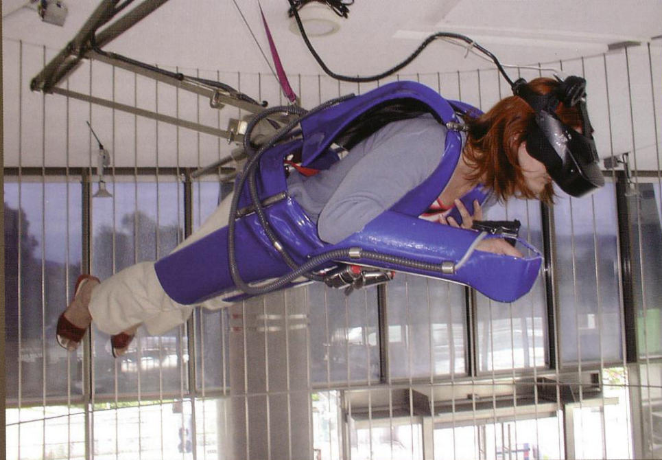
Virtuálna realita v Centre Ars Electronica, 2002