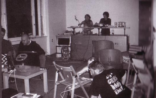
Workshop práce s digitálnym nástrojom na prácu s multimédiami v reálnom čase Pure Data (...). Burundi datalab studio displej press, A4 – nultý priestor (Námestie SNP 12, Bratislava)

komplexnosť a závažnosť tohto samostatného sveta vo svete. Bola to taká moja iniciácia a odtiaľ pramení moje uvedenie si záujmu o spojenie technológií a kultúry. (Hoci domáce projekty existovali aj predtým, boli také rozpriestranené v čase, nekoncentrované, potrebovali objavovanie, že som ich začínala vnímať ako niečo výnimočné až po skončení štúdia dejín umenia, čo je škoda.) Z tohto stretnutia tiež pramenilo pochopenie, že sme absolútne rovnocenní, že netreba mať žiadne komplexy. Atmosféra zdieľania tam bola taká veľká, že nebol problém osloviť kohokoľvek.