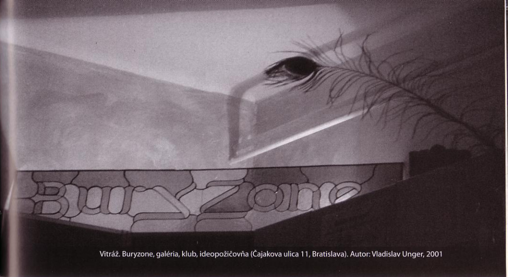
Vitráž. Buryzone, galéria, klub, ideopožičovňa (Čajakova ulica 11, Bratislava). Autor: Vladislav Unger, 2001

čo a ako sa u nás hovorilo o nových médiách. Profil vôbec prinášal celé 90. roky témy a články, ktoré by boli zaujímavé pre mnohých ľudí mimo okruhu umenia. Myslím, že nesporne prispel k popularite termínov súvisiacich s novými médiami, k pochopeniu, že ide o niečo výnimočné. Časopis má podiel na šírení myšlienok nových médií, konkrétne toto číslo je podľa mňa vyvrcholením jednej fázy popularizácie umenia nových médií. Symbolicky prichádza v roku 2000 a prináša texty jednej generácie. Nielen v nových médiách sa často stretávajú generácie, ktoré si majú čo povedať. Ten aktuálny globálny záujem o archeológiu médií a skúmanie histórie je toho dôkazom – tie stretnutia môžu byť fascinujúce a rozlišovanie generácií môže priniesť pochopenie mnohých súvislostí a exaktnejší obraz situácie. Len v našom konzervatívnom prostredí je to nebezpečný pojem, hoci sa mu nedá vyhnúť, preto sa generačné hladisko snažím potláčať, ak je to možné.