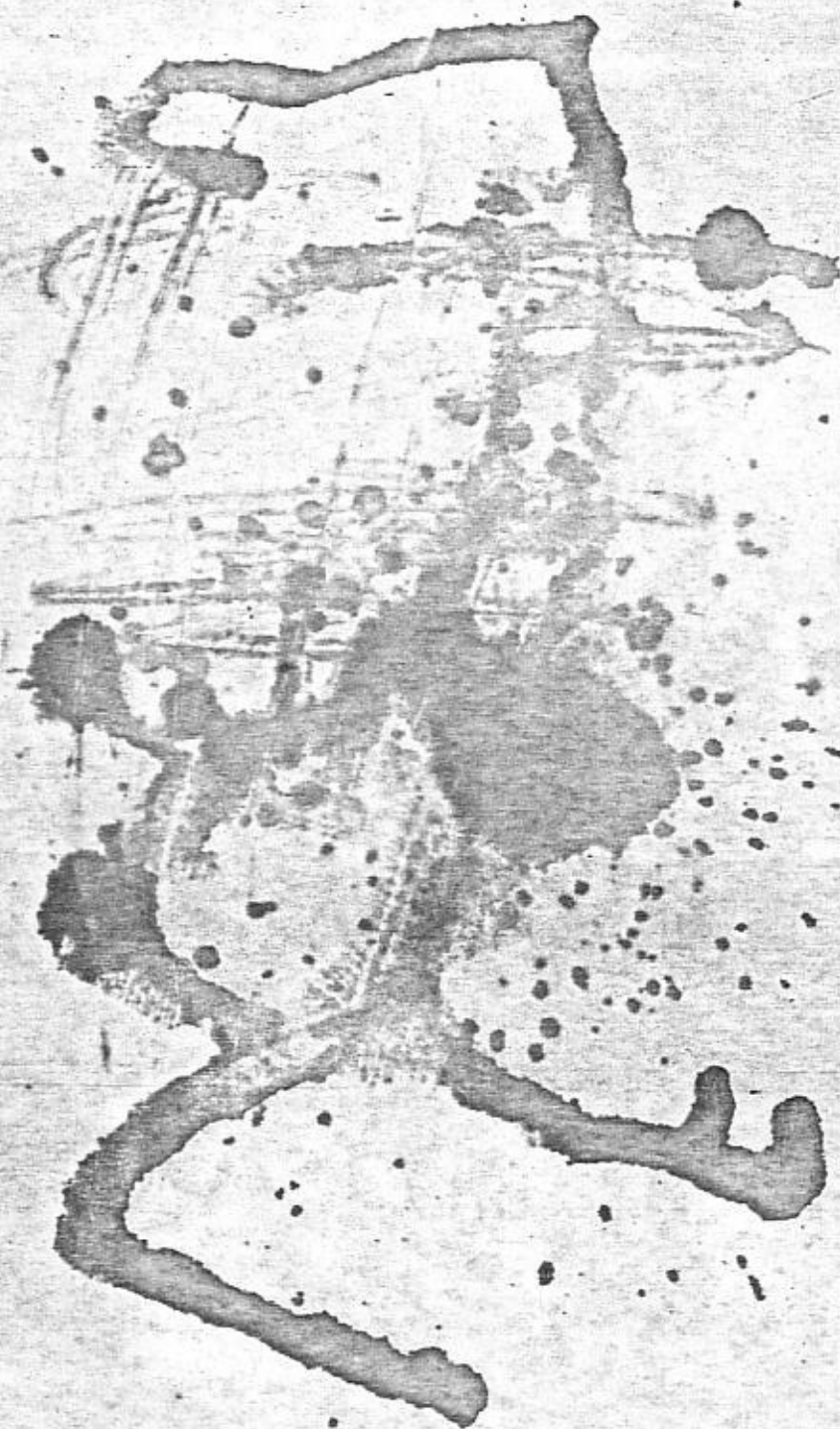
PERO LE KVET - UTEKAJÚCA POSTAVA (1987)