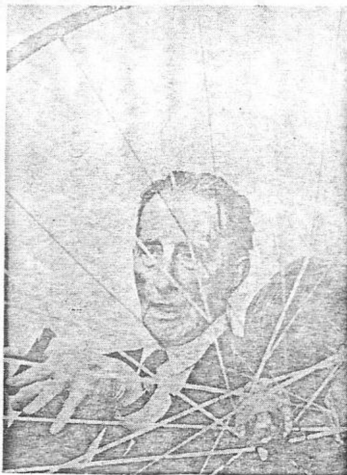
MARCEL D U C H A M P