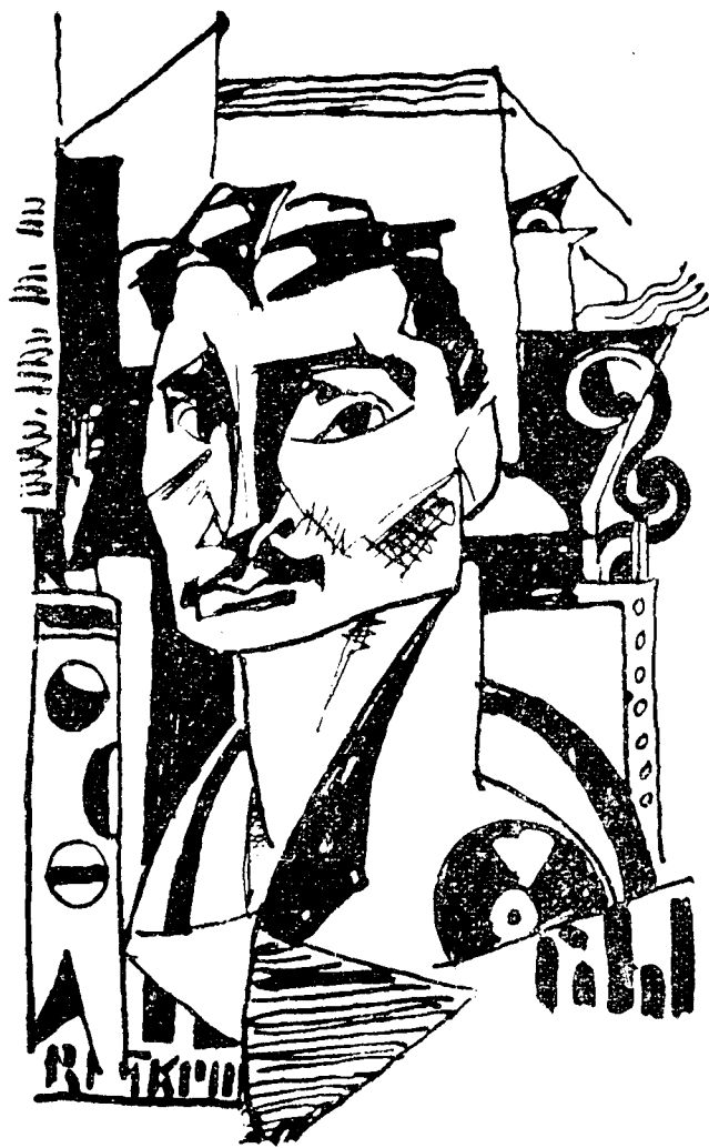
Hurmuz Portret de Marcel Iancu