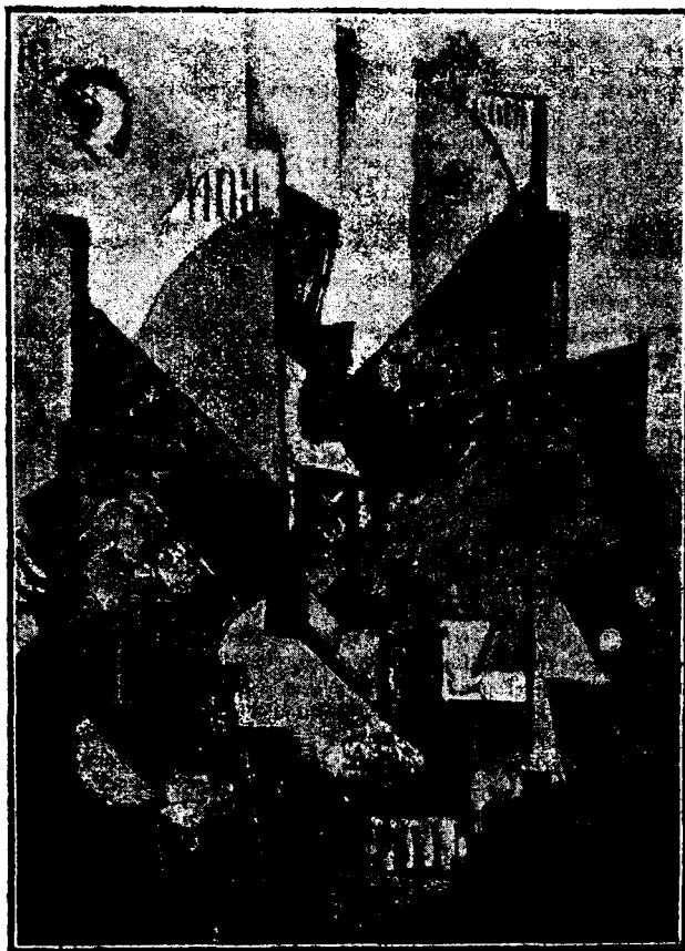
Construcție de Marcel Iancu