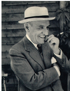
José Ortega y Gasset

degger, en Baden Baden. En 1955, diagnosticado de cáncer gástrico, regresó definitivamente a España, y murió el 18 de octubre en Madrid.